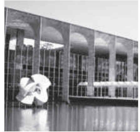
EN ITAMARATY EL FUNCIONARIADO HABLA CORRECTO CASTELLANO

Observamos el esfuerzo que está haciendo el gobierno brasileño donde todo su funcionariado habla cómoda-