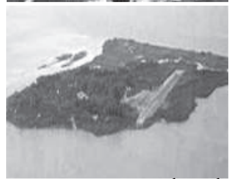
ISLA MARTÍN GARCÍA

unos u otros, a ambas bandas del río, de recaer en una absurda contienda de espaldas a las chácharas y expresiones continuas y mediáticas sobre una posible "unión continental". Los hechos lo dicen: nada más lejano a ello. Y existen una infinidad de cuentas para este rosario: el continuo corrimiento del Pontón de Recalada aguas al Este, el uso de los puertos de Buceo y Piriápolis por los prácticos argentinos, la prohibición de que los mercantes con destino a Buenos Aires recalen en el puerto de Montevideo, etc. ¿para que más!