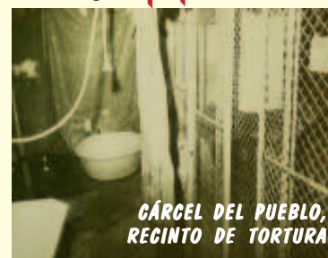
CÁRCEL DEL PUEBLO, RECINTO DE TORTURA

Las Fuerzas Armadas nacieron con la Patria y viven con y para ella, manteniendo su misma continuidad histórica la que no admite ningún fraccionamiento cronológico. FIN